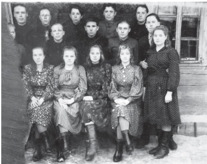
Звено бригады «Зенюки», председатель к-за им. Сталина, 1951 г.