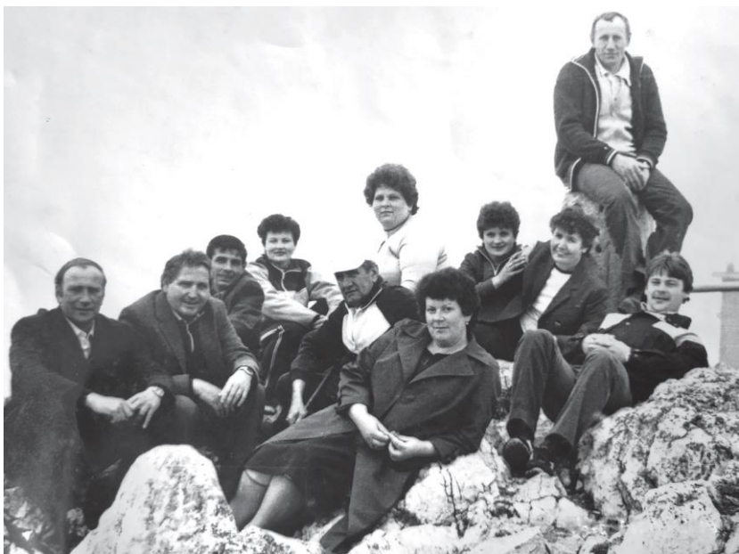
Коллектив хозяйства в турпоездке, начало 80-х гг.