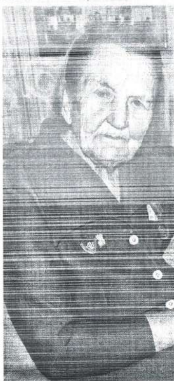
Софія Сяргееўна часта разглядае сямейныя альбомы