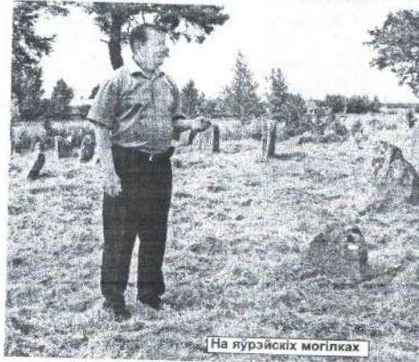
На яўрэйскіх могілках

гэта школа адкрыла сезон палявых школ цэнтра "Сэфер": літаральна праз тыдзень пачне працаваць палявая школа ў Латвіі, а затым і ў Малдове.