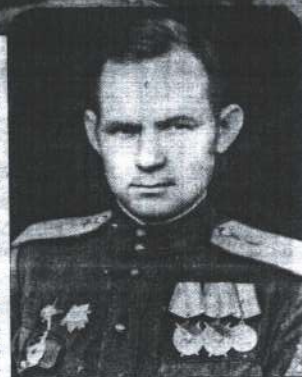
Герой Савецкага Саюза П.М. Батыраў

вы лётчык працягваў вылятаць на штурм і разведку варожых пазіцый, вёў барацьбу з фашысцкімі знішчальнікамі. Хутка гвардыі капітан П. Батыраў быў удастоены другога ордэна Чырвонага Сцяга.