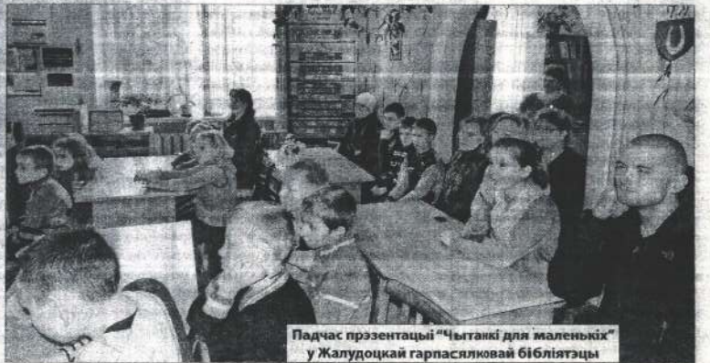
Падчас прэзентацыі "Чытанкі для маленькіх" у Жалудоцкай гарпасяляковай бібліятэцы