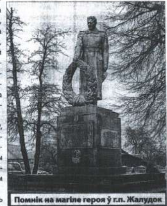
Помнік на магіле героя ў г.п. Жалудок