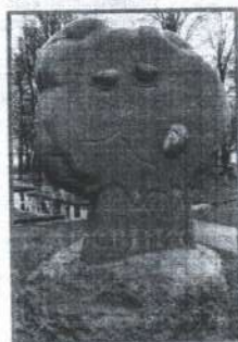
■ Памятник желудям.

НЕСВЕДУЩИЙ заезжий гость название этого населенного пункта Щучинского района произнесет как прочтет только так — ЖелУдок. Не потому ли, подумает он, что здесьние места славятся своими кулиарами или несколько столетий назад у проезжавшего мимо этого местечка знатного барина прихватило живот, а местные знахарки его вылечили? Ничего подобного. На самом деле, научил меня местные жители при встрече, правильно ударение ставить на последний слог — ЖелудОк. То есть в «честь» желудка, и никак иначе. Что, впрочем, не отменяет оригинальные исковые истории, которые таит в себе эти удивительные места.