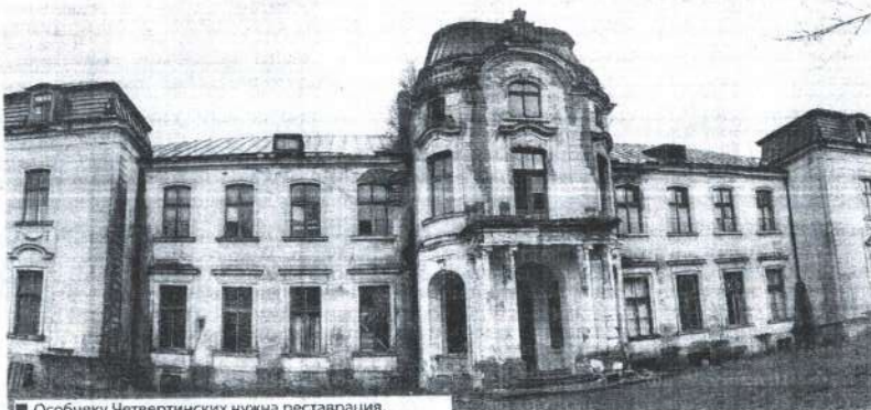
■ Особняку Четвертинских нужна реставрация.

Наталья БОРИСОВЕЦ, «СТ»