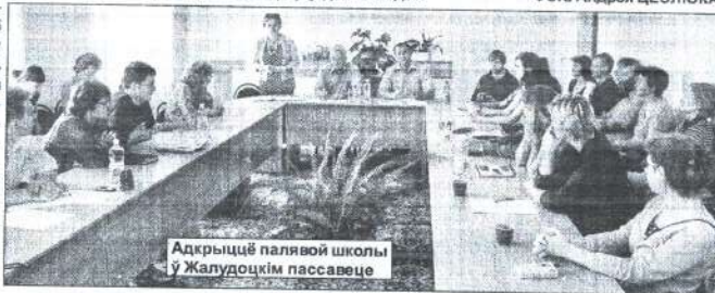
Адкрыццё палявой школы ў Жалудоцкім пассавеце

жэўнага ўніверсітэта, пішу дыплом па гісторыі яўрэяў. У падобнай экспедыцыі прымаю ўдзел другі раз. Я нарадзілася ў каталіцкай сям'і, аднак з цікавасцю вывучаю гісторыю яўрэйскага народа. А расла ў такім жа мястэчку, як Жалудок, таму мне як мага больш хочацца ведаць пра такія ж населеныя пункты. Думаю, што абсалютна ўсё, што дзевяццацца мне тут пацуць і знайсці, будзе вельмі даражчым і маёй даследчай дзейнасці.